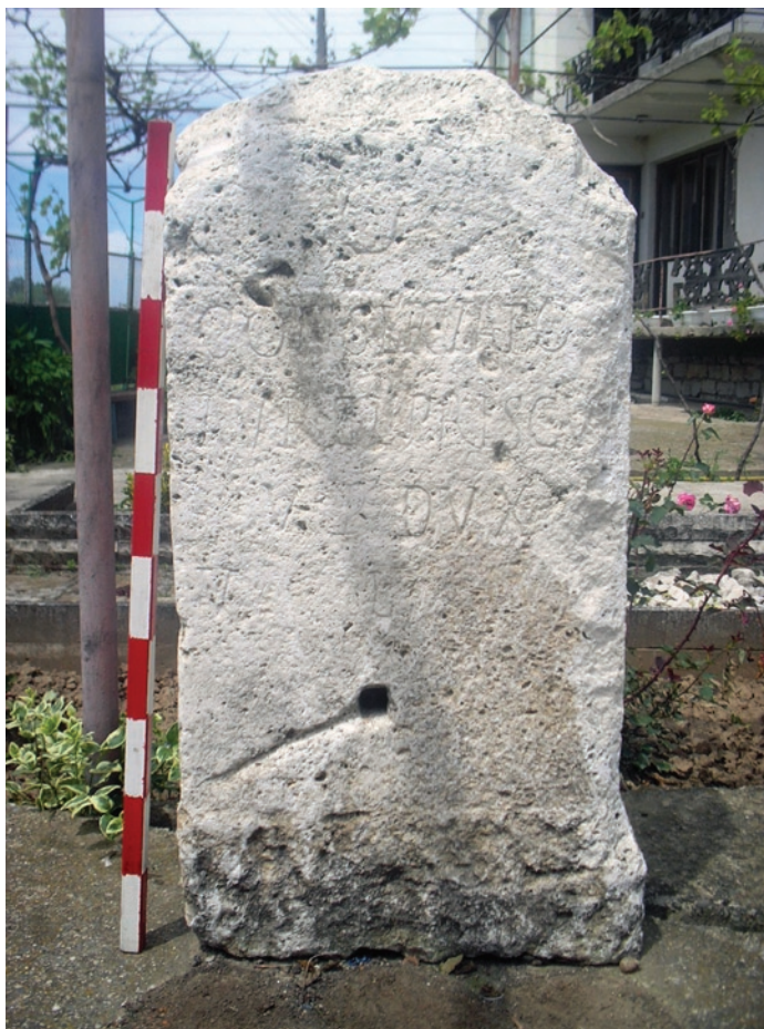
Обр. 2. Теренни обхождания на територията на Община Димово и Община Белоградчик, Област Видин. Посветителен латински надпис от с. Дреновец.

с. Дреновец. В един от частните дворове на селото е запазен латински посветителен надпис на dux Daciae Ripensis – Aurelius Priscus 1 . Надписът е посветен на езическо божество и може да бъде датиран в края на III или самото начало на IV в. (обр. 2).